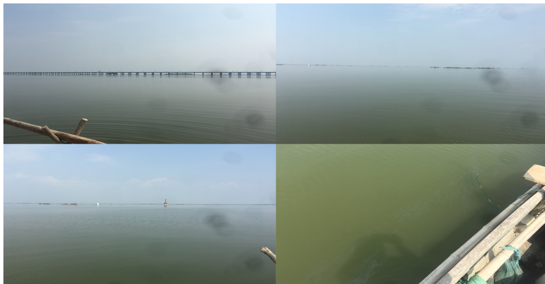
图 2. 采样点四周照片