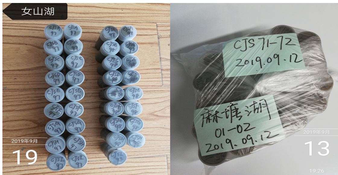
图 4. 分装好的沉积物样品